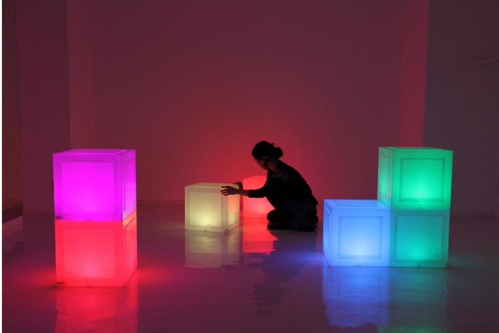
teamLab 《Media Block Chair》